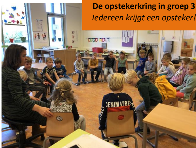
De opstekerkring in groep 3 Iedereen krijgt een opsteker!